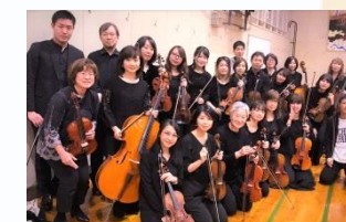
私たちがアンサンブル“弓”です！