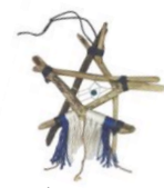
昨年の流木教室は ドリームキャッチャー作り♪