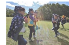
昨年は熊の沢公園で 忍者修行☆☆☆