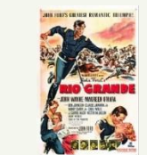
シネマサロンなないろ