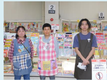
(写真上・下)スタッフのみなさん