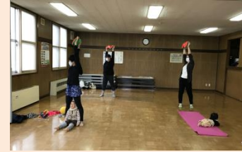
健康体操教室 【もみじ台南第2集会所】

フランスやニジェールなどのアフリカ諸国に10年、ボランティアや勉強がきっかけで在住、人種や宗教、歴史的背景による違いから生じる軋轢を身近に感じ、異文化において人とのコミュニケーションの大切さを学びました。その後帰国し、日々の生活のギャップに強いストレスを覚え、これでは身が持たない、とそれまで経験のあったロードバイクや水泳を生かしてトライアスロンにチャレンジすることで日々体を動かすことが精神にも大きな良い影響を及ぼすことを知りました。