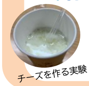
チーズを作る実験

◆月イチ☆ヒロバ 移動プラネタリウム 日 時 3月25日（土）①10時～②11時～ 参加費 無料 定員 各回20名