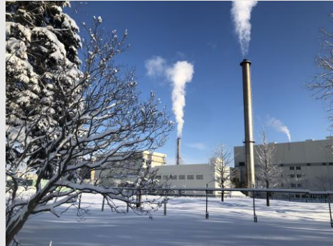
厚別エネルギーセンター（厚別東3条1丁目1-1）