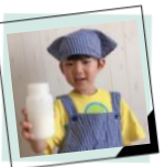
月イチ☆ヒロバ 牛乳からつくろう！チーズとバター2