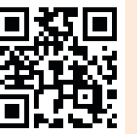
ホームページ QRコード