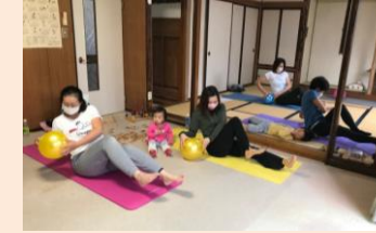
ピラティスサークル 【楽らく庵 もみじ台北】

時を経て結婚、出産と運動から遠のいていたものの、産後の運動不足を解消にとエクササイズやジョギングを再開した直後、体を痛めてトホホ、の気分でした。せっかく運動する気になったのに、このままではいけないと、今度は故障しないで正しい体の使い方を学びたいとピラティスを会得し、並行して楽しくて通っていた健康体操教室で指導者の資格をとることにしました。