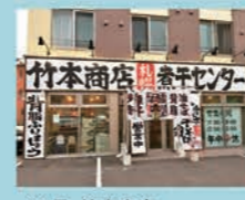
14号 竹本商会 札幌煮干しセンター