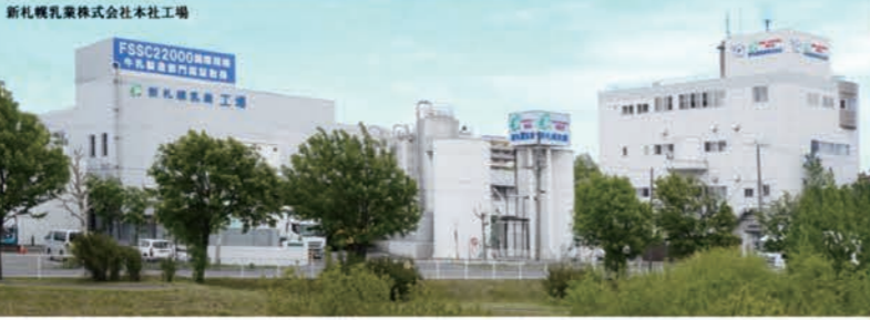
野津幌川沿に新札幌乳業の白い工場がならんでいます（厚別東4条1丁目1-7）