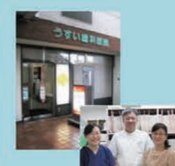
15号 うすい歯科医院