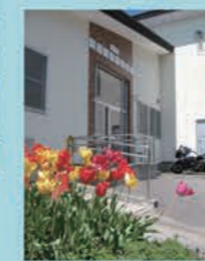
16号 もみじ台児童会館