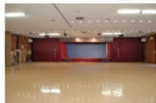
大ホールA (全面)、B・B' (半分)、C・Dに分割可能 Bには舞台、Cにはミラー有り / 2階、418㎡、400人