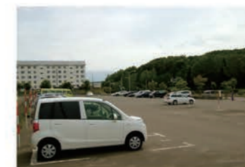
B駐車場 (熊の沢公園側：下段)