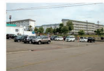
A駐車場 (もみじ台消防署裏：上段)