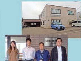
27号 札幌福祉医療器(株)