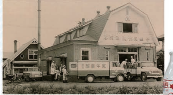
上：JR 厚別駅前にあった「札幌市厚別酪農協同組合」 右：宅配で親しまれた「酪農牛乳」の瓶