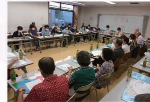
民生委員・児童委員協議会の定例会の様子

民生委員・児童委員はみなさんの地域の身近な相談相手です。もみじ台地域には42名の民生委員と3名の主任児童委員が活動しています。毎月訪問を希望される70歳以上の一人暮らしの方の安否を確認しています。困りごと、心配事があるときは気軽に相談してください。民生委員は専門職員ではないので必要な専門機関にお繋ぎするのが役割です。近所の顔見知りの身近な相談相手です。