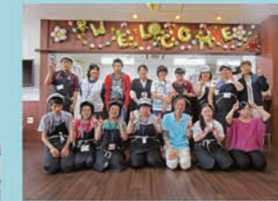
23号 光生舎く・る・る