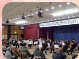
もみ人ふれあいコンサート 出演：アンサンブル“弓”