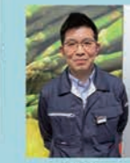
25号 ホクノスーパー 中央店