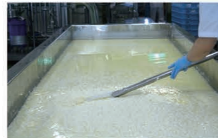
チーズ製造作業の様子

先日実施した管理センターの講座でも、牛乳からカッテージチーズをつくったり、生クリームからバターを作ったりする体験をさせていただきました。子どもも大人もみんなとても楽しんで参加していました。ありがとうございました！