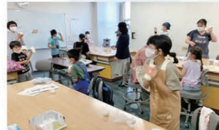
7月3日（日）に開催した講座の様子 生クリームをたくさん振ってバター作りに挑戦